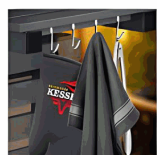
Super practical hook