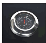
Integrated thermostat Pay attention to the temperature to ensure a real taste miracle.