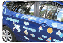
Car decoration stickers

When the residual gum left by the adhesive is not effectively removed for a long time, it can cause the adhesive to turn black and yellow, affecting the appearance of the item. Severe acidic adhesive can also corrode your item