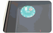
Car annual inspection stickers