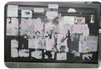
Billboard gum residue