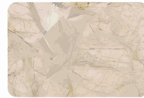
Adhesive on marble