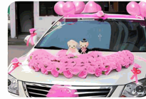
Adhesive stickers after happy events