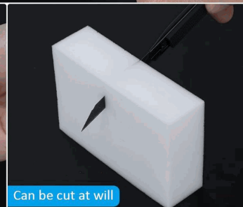
Can be cut at will