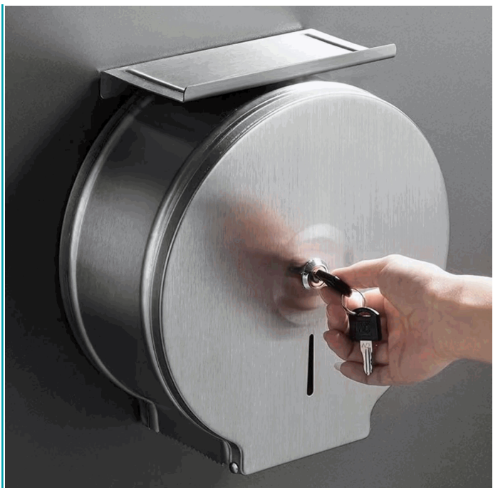
WALL MOUNTED PAPER TOWEL DISPENSER