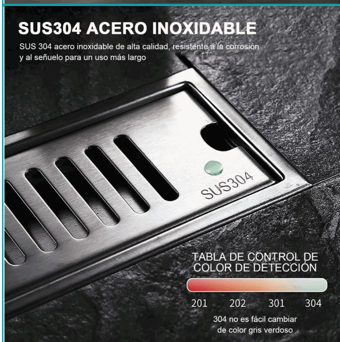
TABLA DE CONTROL DE COLOR DE DETECCIÓN

SUS 304 acero inoxidable de alta calidad, resistente a la corrosión y al señuelo para un uso más largo