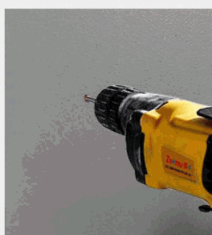
2. Punch with 6mm electric drill