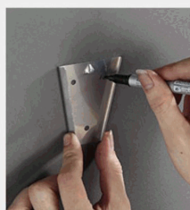
1. Mark position