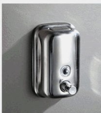
6. Installation completed