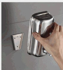
5. Hang the soap box