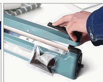
Paso 4 - Presione el mango y la luz roja se encenderá. El sellado se completa cuando la luz roja se apaga.