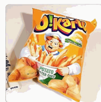
4-5 para bolsa de aluminio