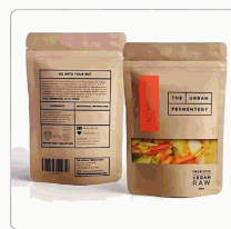
6-8 para bolsa de papel kraft