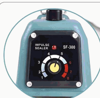
Estancamiento de Temperatura

Ajuste la temperatura de sellado según el material y grosor de la bolsa.