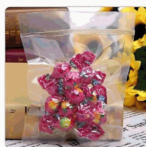
1-2 para bolsas de plástico normales