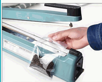
Paso 3 - No se necesita tiempo de calentamiento. Coloque la bolsa en la máquina selladora.