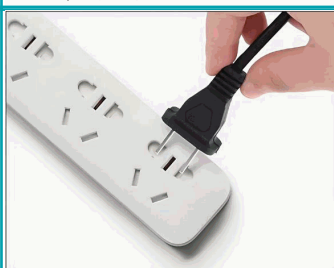
Paso 1 - Conecte la fuente de alimentación.