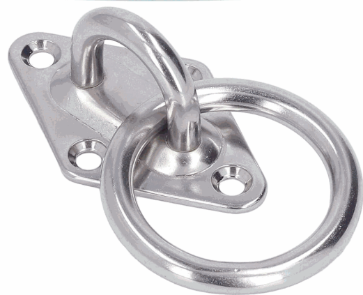
Anillo de diamante con M8