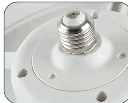
Conector tipo bombilla