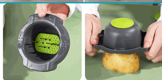
Take out the hand guard