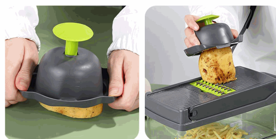
Press the hand guard down vertically