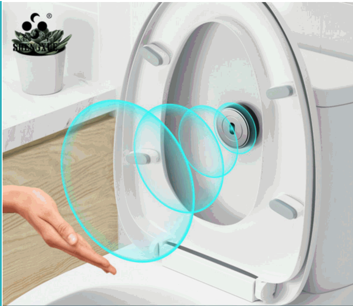
Contactless toilet sensor flush