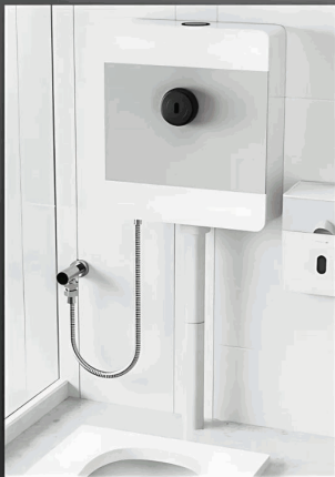
TOILET TANK INSTALLATION