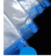
LEAK-PROOF DOUBLE-LAYER SEALING