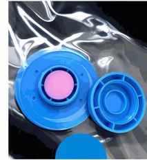
GOOD VALVE SEALING PERFORMANCE