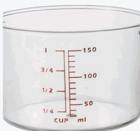
Lid with an additional measuring cup.