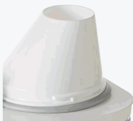
Beak-shaped slanted opening design