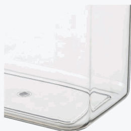
Crystal-clear jar body