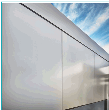
Lámina De Aluminio Compuesto Acm 4Mm PvdF 1.22X2.44M (4X8Pies) Panel Revestimiento Exterior De Alta Calidad Color Silver B018