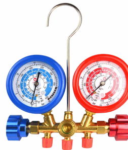
• 3 Valve Gauge