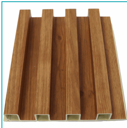
Lámina Acanalada Decorativa Wpc Para Paredes, Techos, Muebles, Compuesto Madera Y Plástico. 24X160X2900 Mm