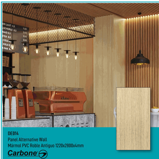
DE014 Panel Alternative Wall Mármol PVC Roble Antiguo 1220x2800x4mm Carbone

Panel Decorativo Mármol Pvc Para Paredes, Techos, Muebles, 1.22 M X 2.80 M X 4 Mm. Acabado: Roble Antiguo