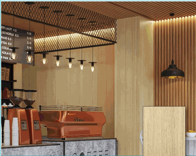
DE014 Panel Alternative Wall Mármol PVC Roble Antiguo 1220x2800x4mm Carbone