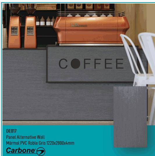
DE017 Panel Alternative Wall Mármol PVC Roble Gris 1220x2800x4mm

Panel Decorativo Mármol Pvc Para Paredes, Techos, Muebles, 1.22 M X 2.80 M X 4 Mm. Acabado: Roble Gris