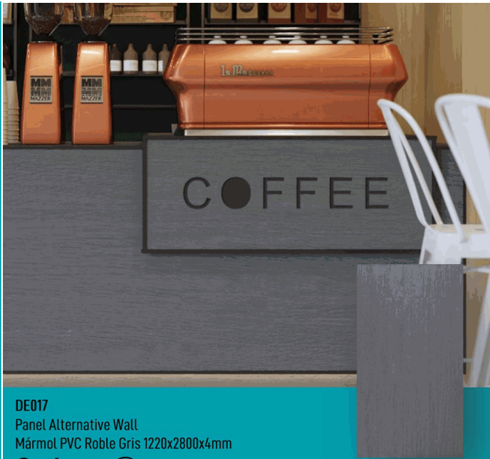
DE017 Panel Alternative Wall Mármol PVC Roble Gris 1220x2800x4mm