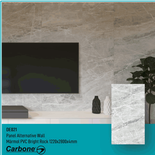
DE021 Panel Alternative Wall Mármol PVC Bright Rock 1220x2800x4mm

Panel Decorativo Mármol Pvc Para Paredes, Techos, Muebles, 1.22 M X 2.80 M X 4 Mm. Acabado: Bright Rock