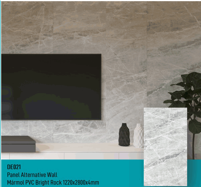
DE021 Panel Alternative Wall Mármol PVC Bright Rock 1220x2800x4mm