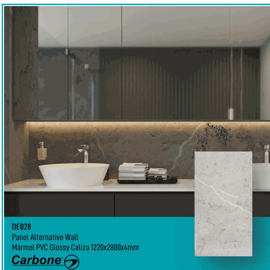
DE028 Panel Alternative Wall Mármol PVC Glossy Caliza 1220x2800x4mm