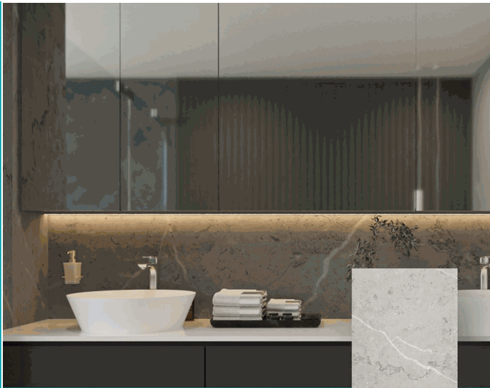
DE028 Panel Alternative Wall Mármol PVC Glossy Caliza 1220x2800x4mm