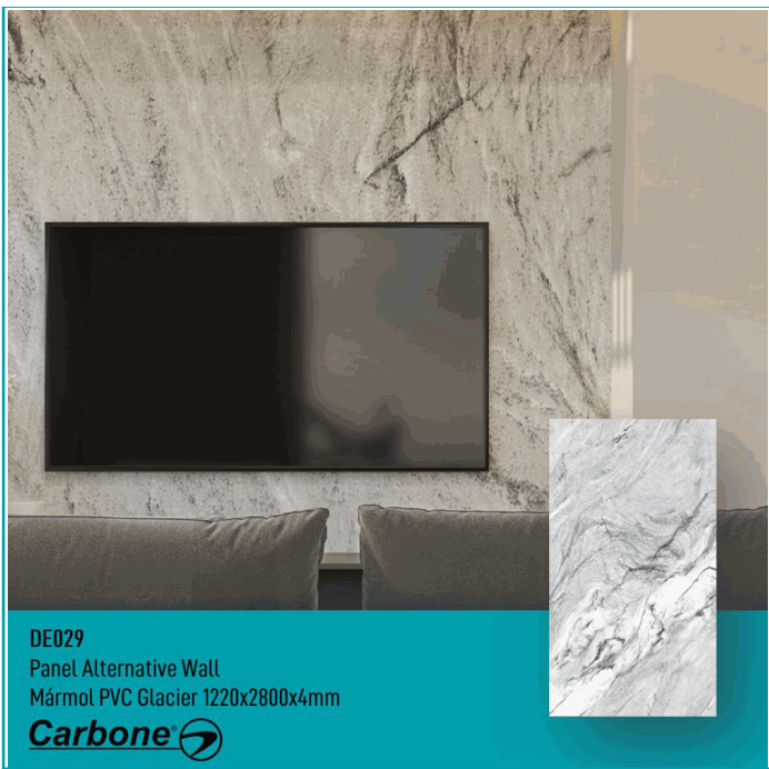
DE029 Panel Alternative Wall Mármol PVC Glacier 1220x2800x4mm