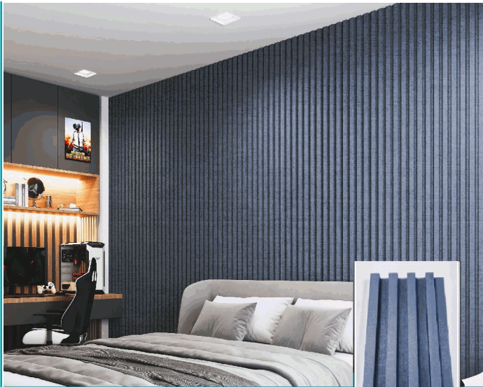
DE056 Lámina Acanalada Decorativa WPC Dark Grey 24X160x2900mm