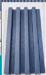
DE056 Lámina Acanalada Decorativa WPC Dark Grey 24X160x2900mm