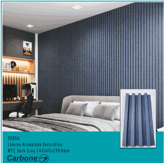
DE056 Lámina Acanalada Decorativa WPC Dark Grey 24X160x2900mm Carbone