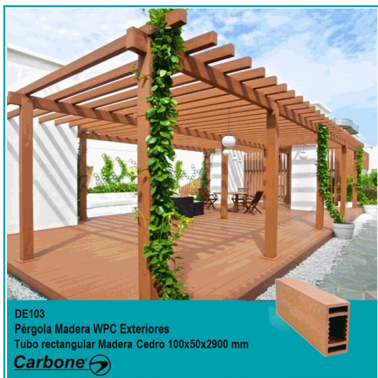
DE103 Pérgola Madera WPC Exteriores Tubo rectangular Madera Cedro 100x50x2900 mm