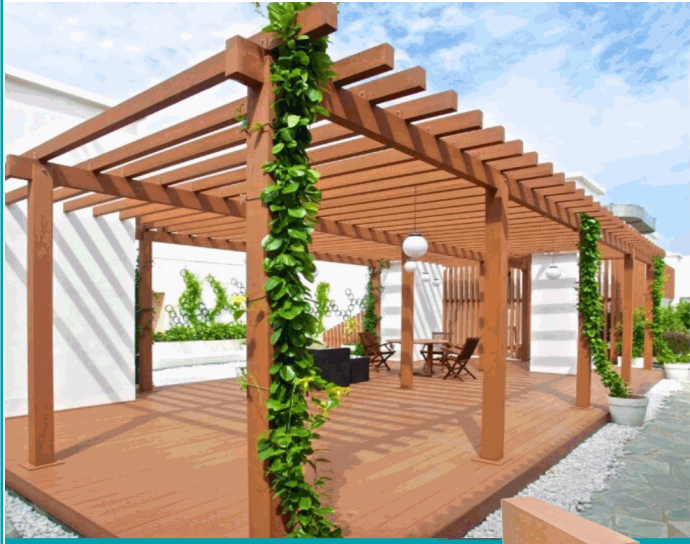
DE103 Pérgola Madera WPC Exteriores Tubo rectangular Madera Cedro 100x50x2900 mm