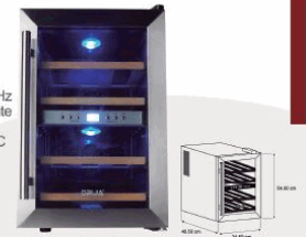
• Vinera de Mesa