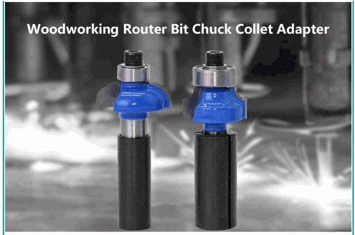
Woodworking Router Bit Chuck Collet Adapter