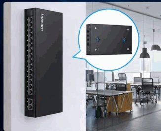
Montado en pared