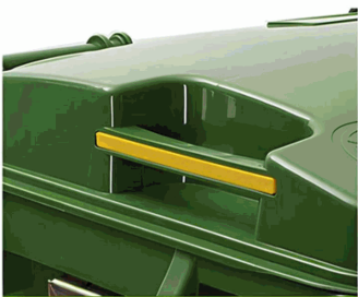
ASA CON REFUERZO