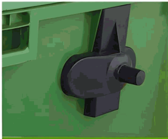
MANIJA DEL REMOLQUE