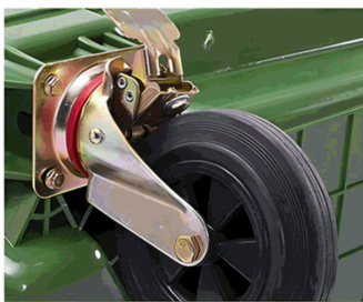
RUEDAS DE GOMA MACIZA