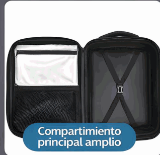
Compartimiento principal amplio