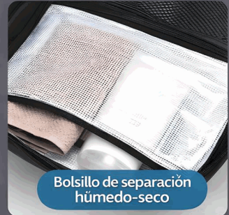
Bolsillo de separación húmedo-seco