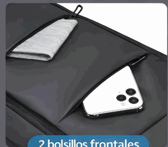
2 bolsillos frontales