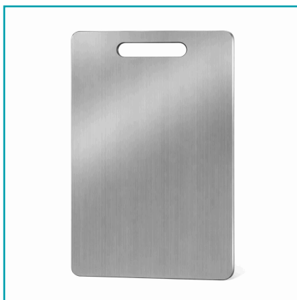
Tabla De Picar Antibacterial Con Doble Cara De Acero Inoxidable. (34X23Cm).