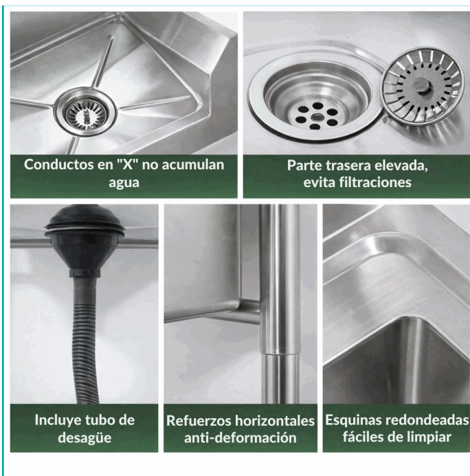
Conductos en "X" no acumulan agua