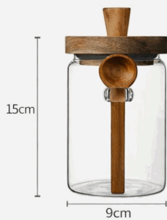
Tarro con tapa de madera hermética (90*150mm)