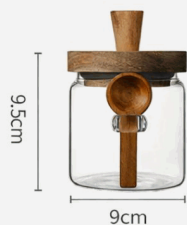
Tarro con tapa de madera hermética (90*95mm)