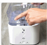
PASO 3 Coloque la taza de almacenamiento en para llenarla de agua.