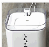
PASO 5 Instale el filtro de purificación.