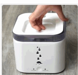
PASO 4 Coloque la bandeja.