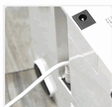
PASO 1 Enchufe el adaptador de alimentación al equipo.