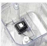
PASO 2 Instale la bomba de agua.