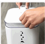
PASO 6 Coloque la cubierta superior.