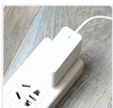
PASO 7 Conecte la maquina para que rocíe agua.