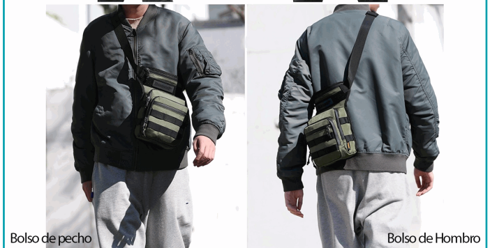
Bolso de pecho