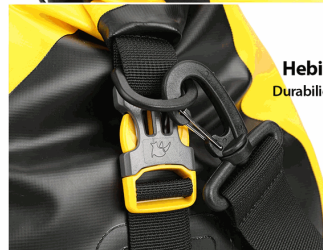
Fondo antideslizante resistente al desgaste Dejalo donde quieras