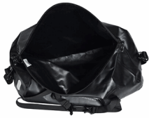
1. Abrir la boca del bolso