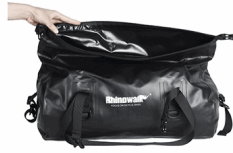
2. Cierra la boca del bolso