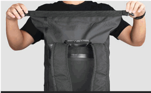
1. Grasp both ends of the opening and fold forward