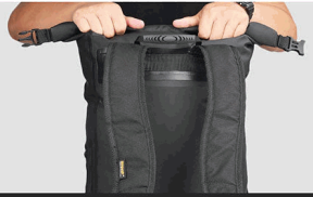
2. Fold forward three times