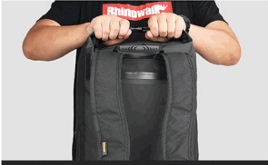
3. Insert the buckles at both ends after rolling