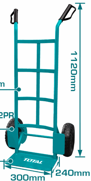
Plate thickness: 3.5mm