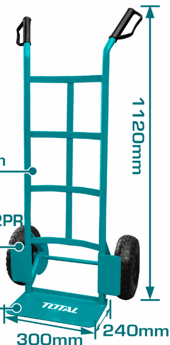
Plate thickness: 3.5mm