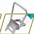
Hook and claw Function