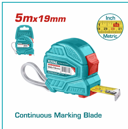
Continuous Marking Blade

Cinta Métrica De Acero De 5 M. Ancho 19 Mm. En Metros Y Pulgadas. Doble Botón. Material De Cubierta Abs. Alta Calidad.