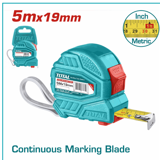
Continuous Marking Blade