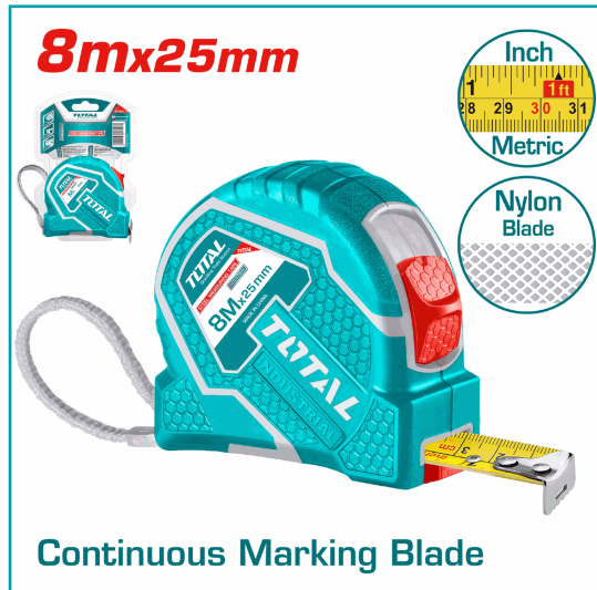
Continuous Marking Blade