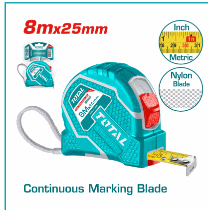
Continuous Marking Blade

Cinta Métrica (Métrico / Pulgada). Acero De 8M. Ancho 25Mm. En Metros Y Pulgadas. Material De Cubierta Abs. Alta Calidad, Boton Doble Y Gancho Mas Fuerte.