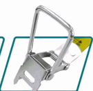
Hook-and claw Function