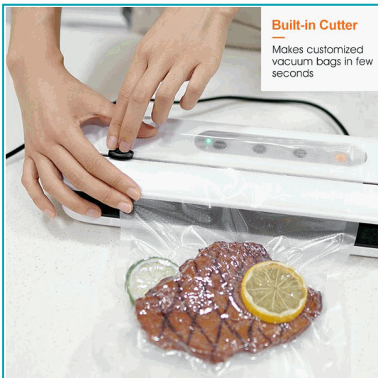
Built-in Cutter Makes customized vacuum bags in few seconds