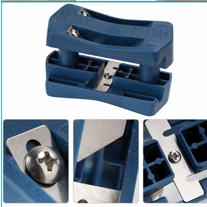
④ Close the trimmer