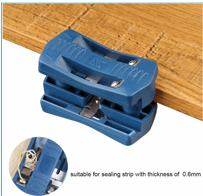
suitable for sealing strip with thickness of 0.6mm