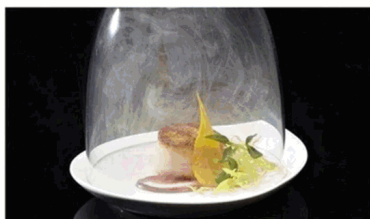
Smoked cheese nuts