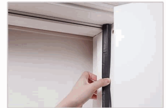
2 Press the PVC flange into the slot inch by inch.