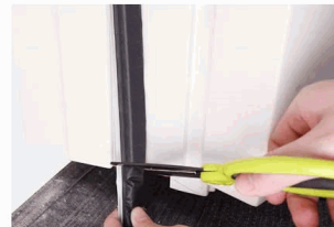
3 Cut the excess strip.