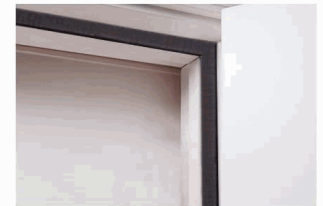
4 Installation finished.