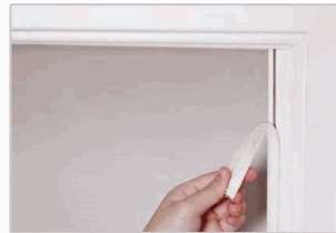
1 Tear off the old strip and clean the slot.