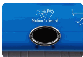
Sensor para dispensar papel