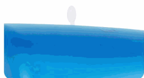
Diseño de cierre antirrobo