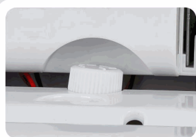
Ajuste del tamaño de salida del papel