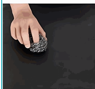
Resistente a los rayones