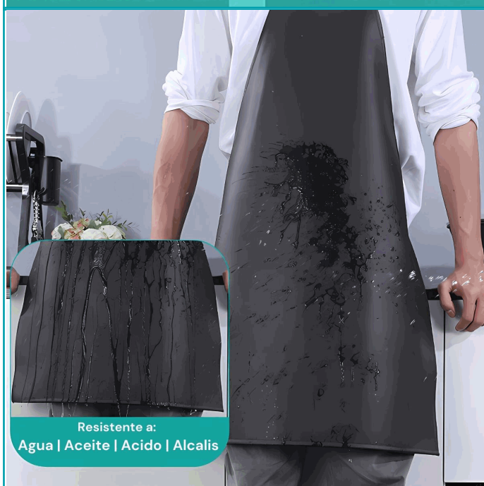
Resistente a: Agua | Aceite | Acido | Alcalis