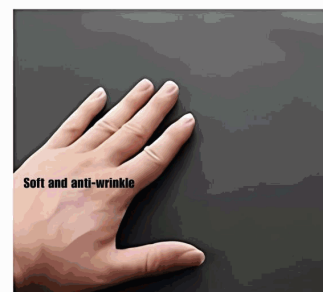
Suave y Sin Arrugas