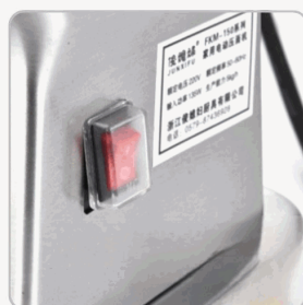
Botón de Encendido