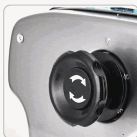
Perilla de Ajuste