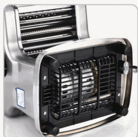
Potente Motor 135W