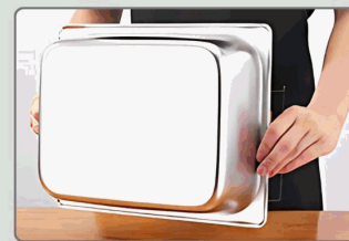
Fondo engrosado, estable y antideslizante