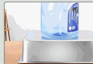
Fuerte capacidad de carga