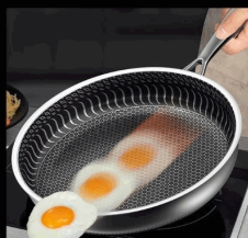
Diseño de doble cara