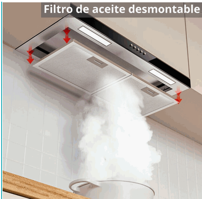
Filtro de aceite desmontable