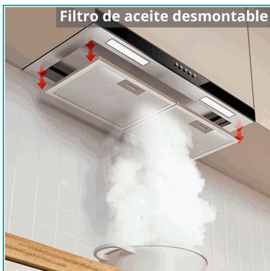
Filtro de aceite desmontable